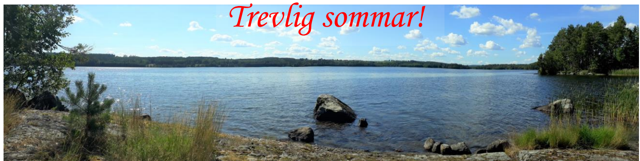
Men innan det blir höst och vinter ska vi hoppas på en varm och skön sommar med sol och kanske bad i någon liten insjö. Bilden från en klippa vid sjön Juttern på gränsen mellan Östergötland och Småland.