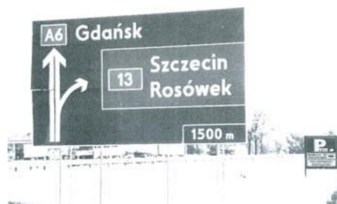
Äntligen är vi i Polen

Väl ombord fick vi så våra hyttnycklar, nu var det bara att inspektera och ta plats i dessa. Godisaffären var öppen så en och annan passade på att handla något stärkande före nattningen. Natten var kort, när jag släckte lyset i hytten så ringde väckarklockan, och vi var i Rostock.