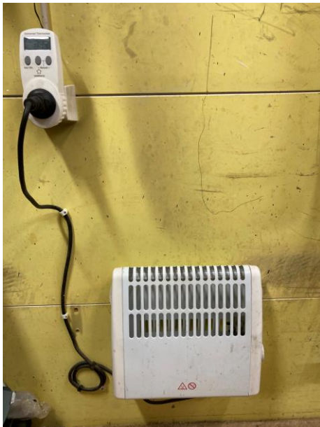
Element med extern avkännare

Många har ju ett kallförråd där man förvarar t ex frukt, potatis eller färg som inte tål minusgrader. Vi sätter då kanske in ett elektriskt element med en inbyggd termostat och så ställer vi det på en siffra som vi tror är lämplig för att temperaturen ska hålla sig över nollan oavsett utetemperatur. Termostaten i elementet bygger troligen på en bimetall och den är inte särskilt exakt Ofta innebär det att det blir stora svängningar i temperaturen, ofta onödigt varmt och därmed slöseri med energi och pengar.