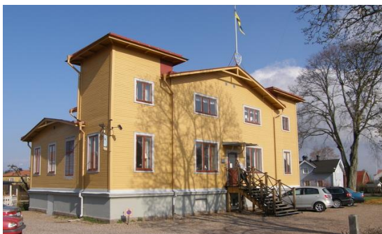
I detta fantastiska Flygets Hus håller vi till.

Omslaget: 10 år sedan första flygningen med Hkp16 i FV regi