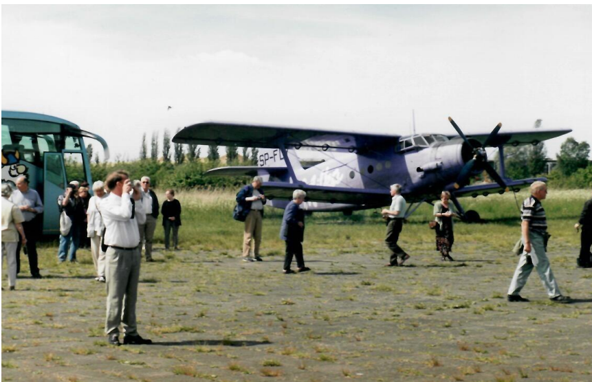
I väntan på flygtur med AN 2