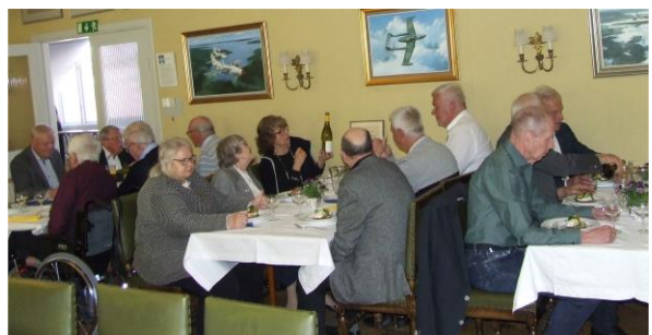
Mat på gång