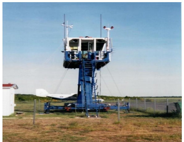
Rester efter övergivandet av flygbasen 1994

För övrigt var allt öde, fränsett kornknarr och näktergal. Man kände historiens vingslag över denna ödsliga bas. Efter detta behövdes en stärkande busskafferast. Färden fortsatte återigen på väg nr 10 till Stettin och till nästa aktivitet.