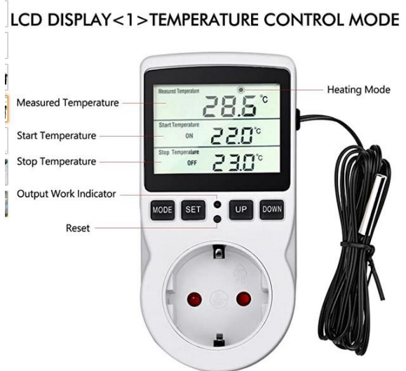
Ex från Internet