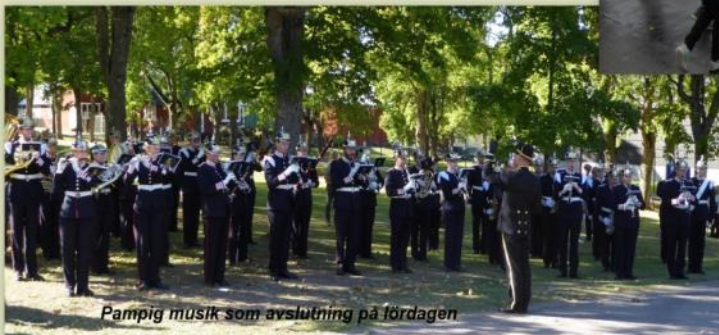
Pampig musik som avslutning på fördagen