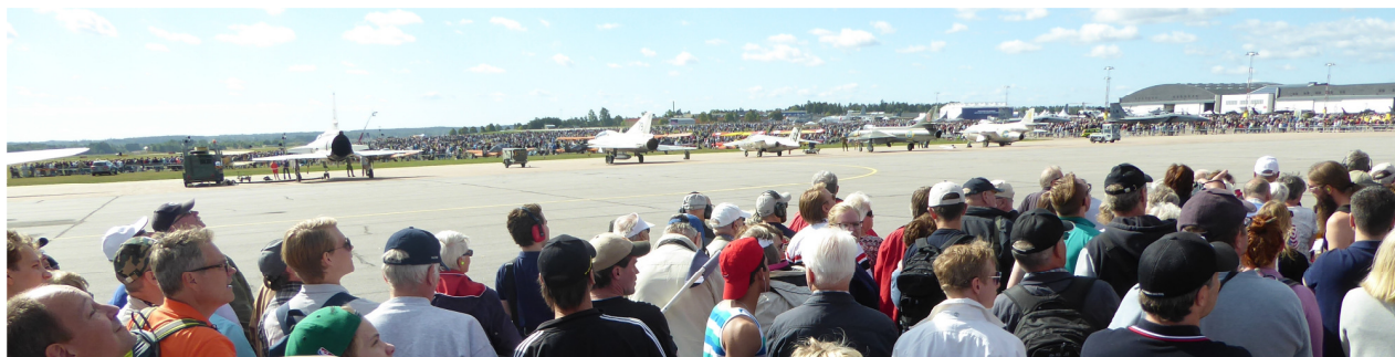
Många huvuden blickar upp mot himlen och i bakgrunden skymtar en liten del av jättepribliken.

Lördagen bjöd på ett fantastiskt fint väder, om än litet blåsigt. Köerna med bilar ringlade redan tidigt på morgonen kilometerlånga på tillfartsvägarna. Trots att man tagit lärdom av kaoset vid flygdagen på F7 förra året och ordnat med flera infarter och flera parkeringar gick köerna inte att undvika. Cykelvägarna till Malmen var fullpackade och bussar gick i skytteltrafik från Linköpings centrum till Flygvapenmuseum. Köerna på busshållplatserna längs Malmslättsvägen var också långa.