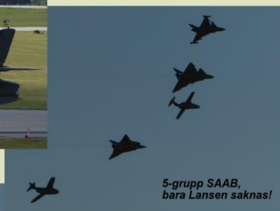
5-grupp SAAB, bara Lansens saknas!