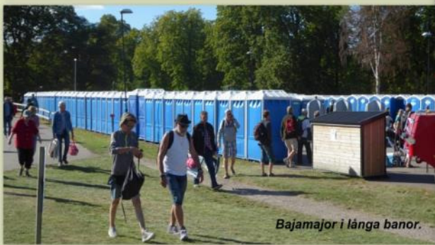
Bajamajor i långa banor.