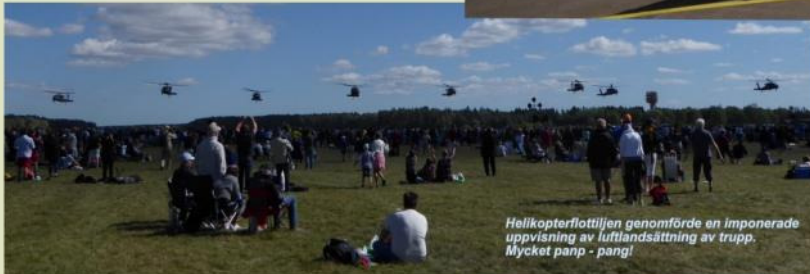
Helikopterflottiljen genomförde en imponerande uppvisning av luftlandsättning av trupp. Mycket pang - pang!