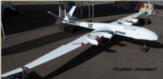
Förlöst - framtiden?