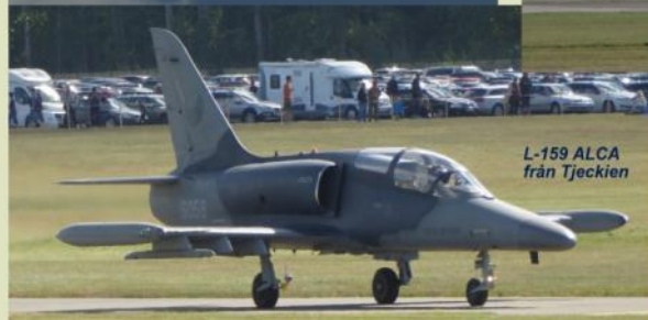
L-159 ALCA från Tjeckien