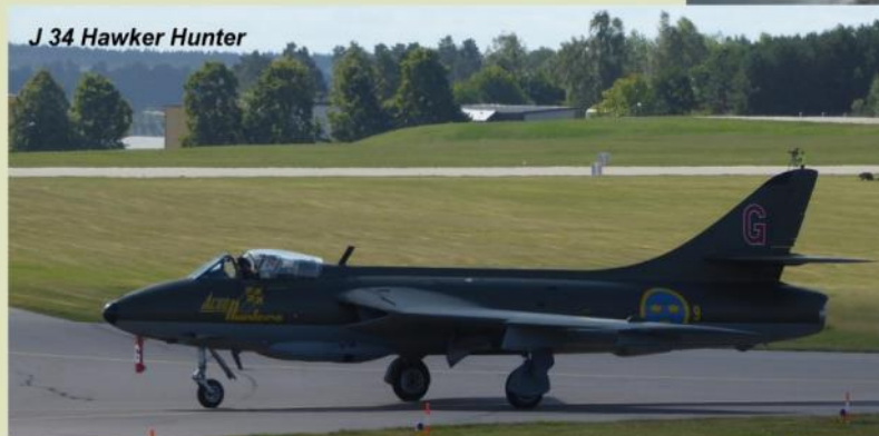
J 34 Hawker Hunter