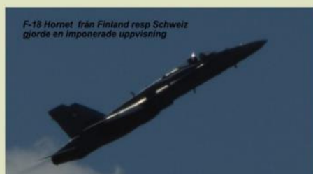
F-18 Hornet från Finland resp Schweiz gjorde en imponerande uppvisning