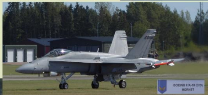
BOEING F/A-18 (C/D) HORNET