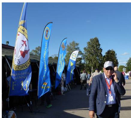
Våra kollegor från F13, F18, F21 och SMKR fanns alldeles bredvid

Besökarantalet på lördagen överträffade sannolikt arrangörernas vildaste fantasier. Enligt den första uppskattningen beräknades att det varit ca 70.000 besökare men senare noggrannare beräkning pekar på att det var minst 90.000 på lördagen. Söndagen bjöd på lite sämre väder och "bara" ca 40.000 besökare. Enligt uppgift satt vissa i 2 timmars bilkö innan de kom in.