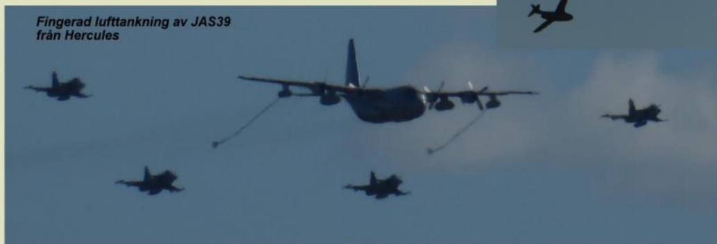
Fingerad lufttankning av JAS39 från Hercules