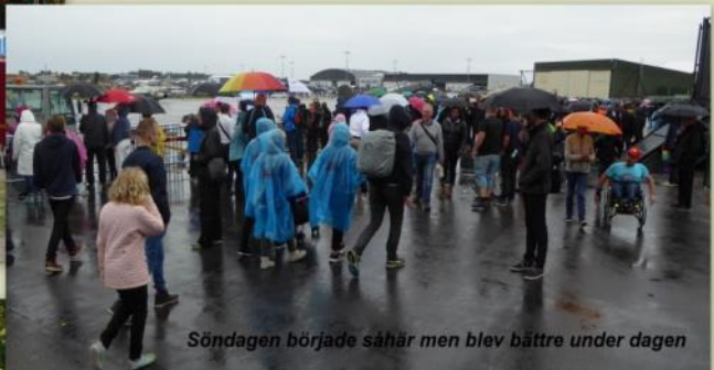
Söndagen började såhär men blev bättre under dagen